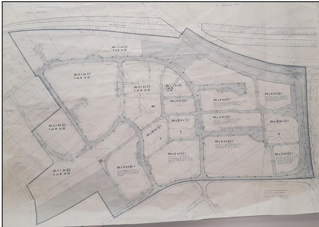
Abbildung 1: Bebauungsplan Nr. 49 (Auszug) | ohne Maßstab